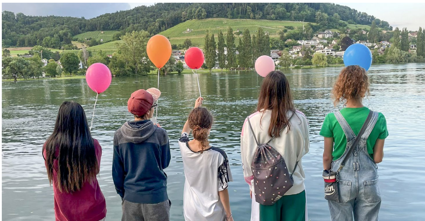
Bewohnerinnen aus dem TheWo Bethanien lassen Ängste und Zweifel ziehen und machen Platz für Hoffnung und Zuversicht.

Am meisten profitiere ich von den wöchentlich stattfindenden Bezugspersonengesprächen. Dort kann ich alles ansprechen, was mich belastet oder mir Freude macht, und auch sonstige Gedanken und Emotionen teilen. Das Vertrauen zu meiner Bezugsperson ist besonders gross, und der enge Austausch zwischen ihr und meiner Psychotherapeutin unterstützt mich zusätzlich. Gemeinsam arbeiten wir an meinen Zielen und an neuen Perspektiven, sodass ich den Kampf gegen meine Essstörung gut bewältigen kann.